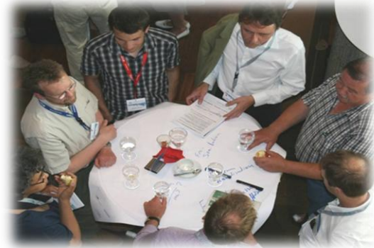
Diskussion und Meinungsaustausch