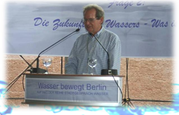
Motivation von Gesellschaft, Politik, Wirtschaft und Wissenschaft