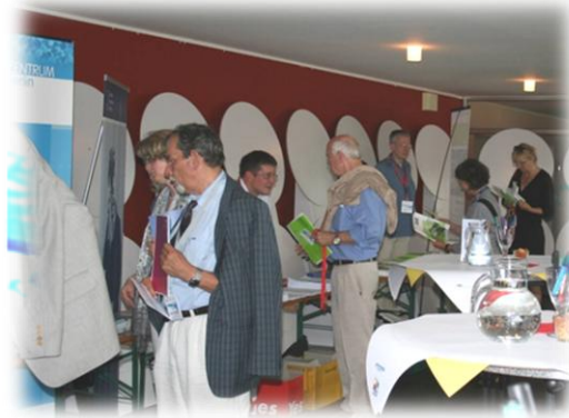
Information zu Akteuren und Projekten